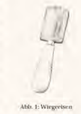
Abb. 1: Wiegeisen