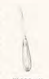
Abb. 2: Polierstab