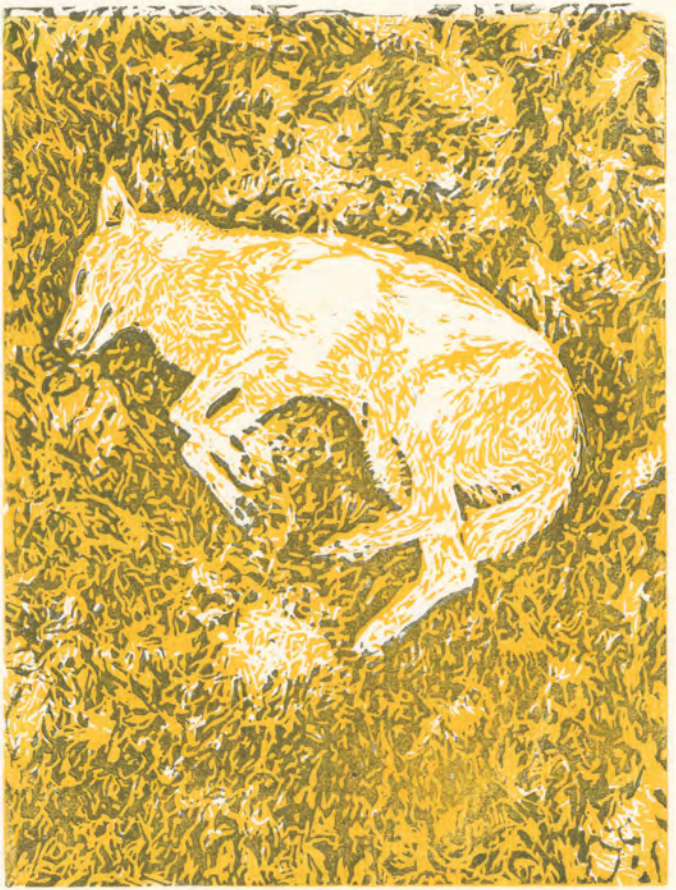
Abbildungen: Zweifarbiges Linolschnitt (gelb und dunkelgrau) und dreifarbiges Siebdruck (gelb, orange und rot)

Kassette II: Hartgrundradierung Kupferstich Kaltnadel Punzen- oder Punktstich Monotypie Farbholzschnitt Linolschnitt Holzstich Federlithografie Pinsellithografie Insgesamt 19 Originalgrafiken bzw. Zustandsdrucke und 11 begleitende Textblätter